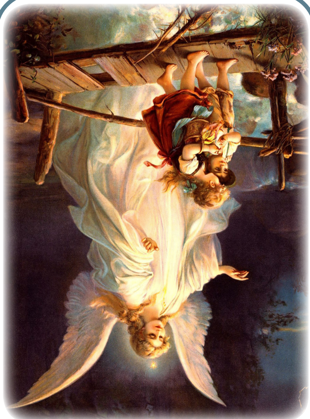
Mijn engelbewaarder 1