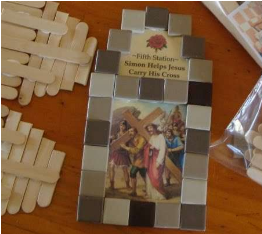
Met ijsstokjes en mozaiektegeltjes/steentjes